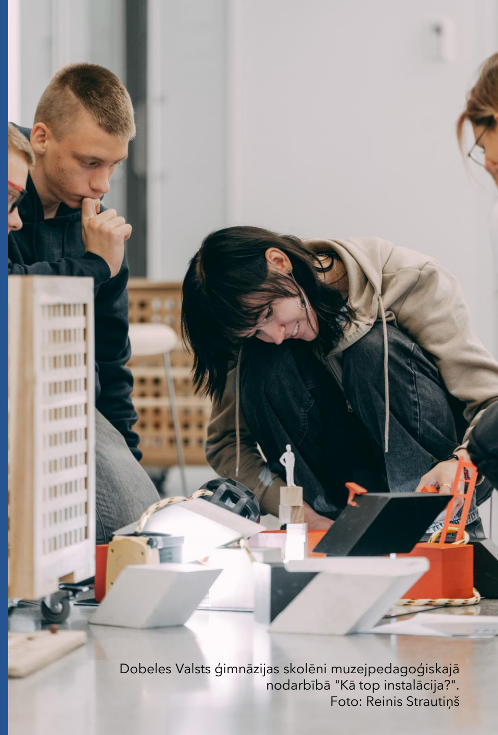
Dobeles Valsts ģimnāzijas skolēni muzejpedagoģiskajā nodarbībā "Kā top instalācija?".