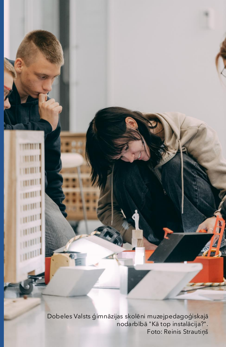
Dobeles Valsts ģimnāzijas skolēni muzejpedagoģiskajā nodarbībā "Kā top instalācija?".

Programmas "Latvijas skolas soma" eksperte administratīvajos jautājumos sabine.ozola@lnkc.gov.lv , 27745355